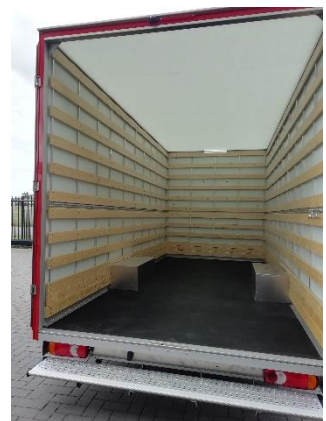
OPTIE: LAT OM LAT