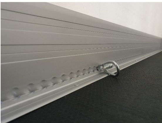
LADINGZEKERHEID GEKEURD EN GETEST.